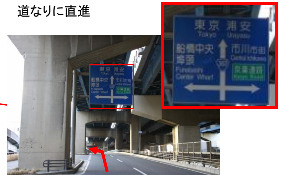
左車線を進み、2つ目の信号を左折、船橋中央埠頭方面へ