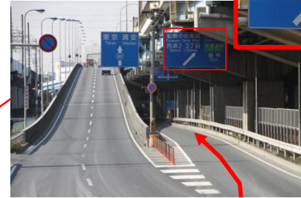
R357を右方向、船橋中央埠頭方面へ